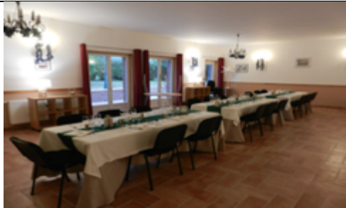
Salle arrière-100 m 2 (polyvalente)