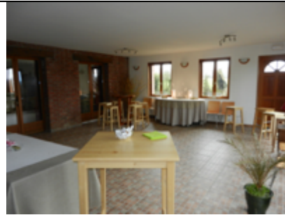
Salle attenante pour pauses-50 m 2