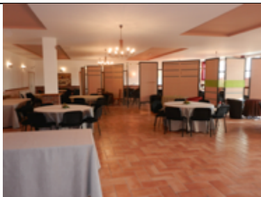
Grande salle (300 m 2 ) – sur ces photos - avec plusieurs espaces