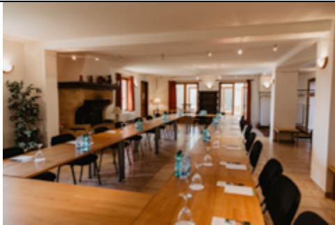
Salle de réunion – 100 m 2