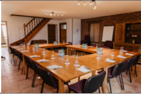
Salle de réunion – 50 m 2