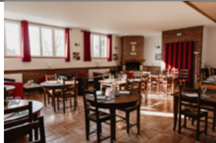
RESTAURANT (100 m 2 )